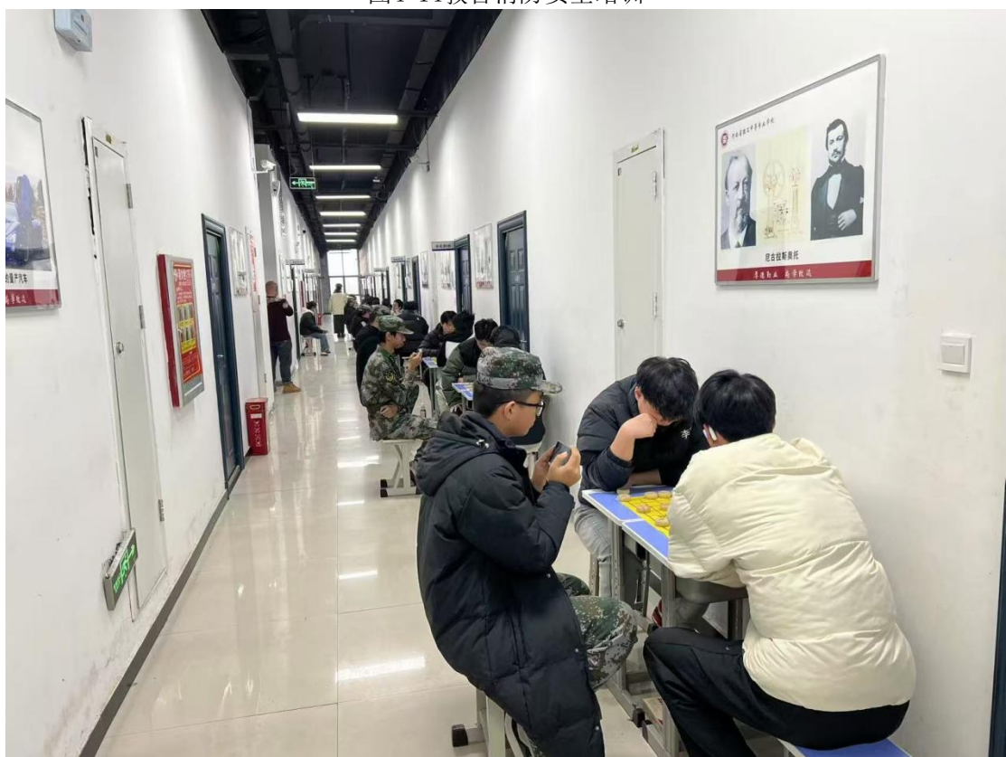
图4-15课余生活——象棋比赛