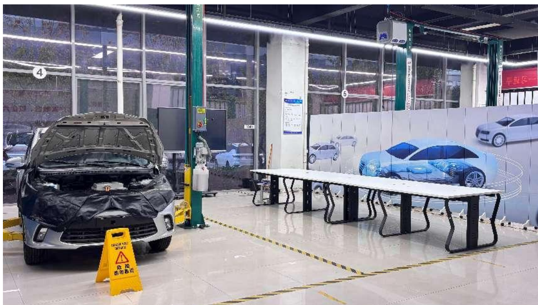
图4-4理实一体实训车间