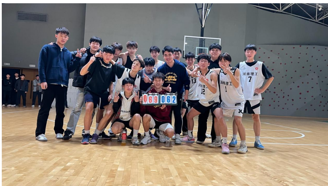
图4-17课余生活——篮球比赛

学校持续深化“校企协同、共育人才”机制，会计事务专业与河南百业、衡信、胜鑫等多家企业建立稳定合作关系，共建“校内实训基地+校外实习工位”的双轨实践平