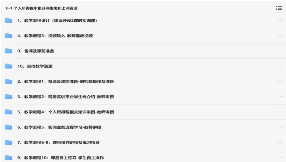
图7-2会计事务专业教学资源

（2）会计事务专业严格选用国家规划教材，依托超星平台建设专业教学资源库，涵盖微课、实训案例、虚拟仿真软件等数字化资源，支持学生自主学习与教师混合式教学。