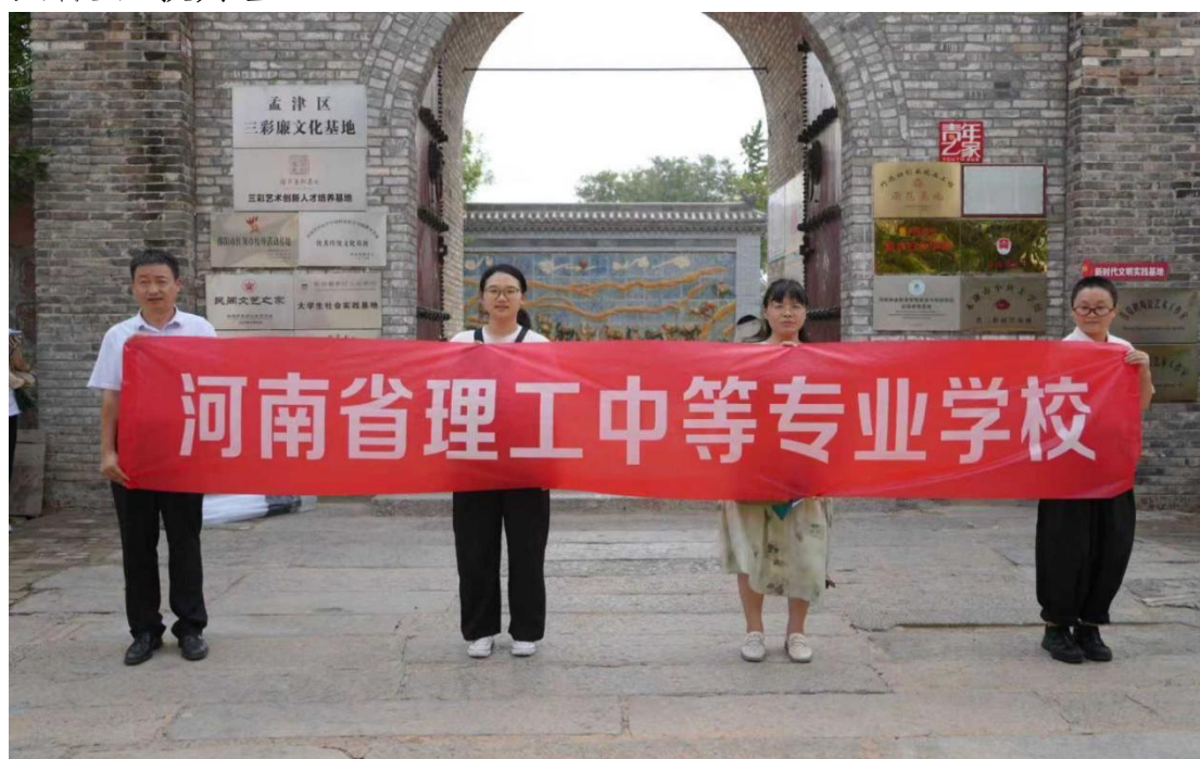
图4-24电子商务专业考察现场

革提供了实践依据。下一步，我校将以此次活动为契机，持续推进与非遗企业的深度合作，构建“教学-实训-创业”一体化育人生态，培养更多“懂文化、善运营、精技术”的复合型电商人才，为河南非遗文化传承与区域经济发展贡献职教力量。