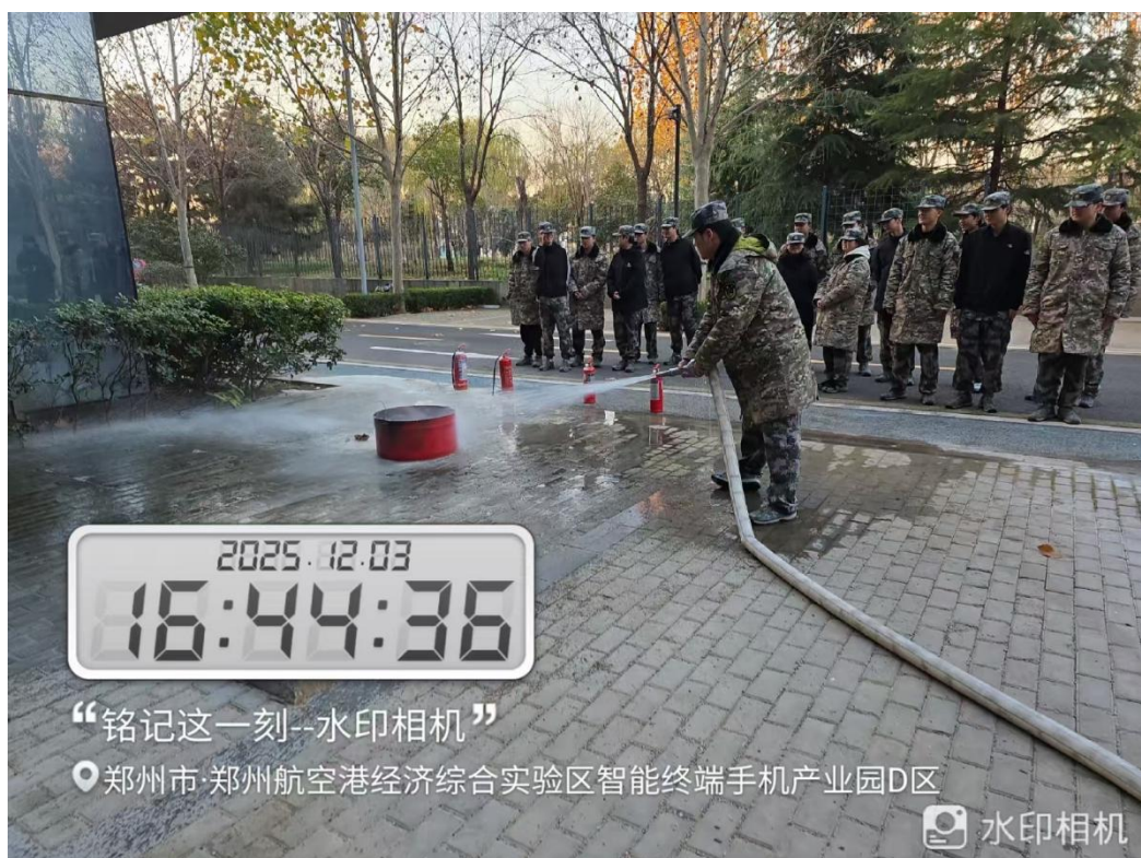
图4-14教官消防安全培训