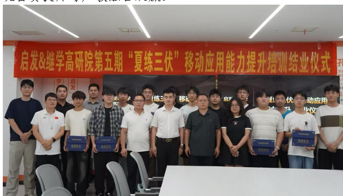
图4-23计算机专业实训现场

实训后，学生移动应用开发熟练度与创新设计能力显著提升，形成的参赛作品融入大赛要求的新技术应用与实用价值。企业为学生颁发实训证书，与学校达成长期备赛合作，双导师共同编写的实训案例纳入学校备赛教材，实现备赛提升与产教融合双赢。