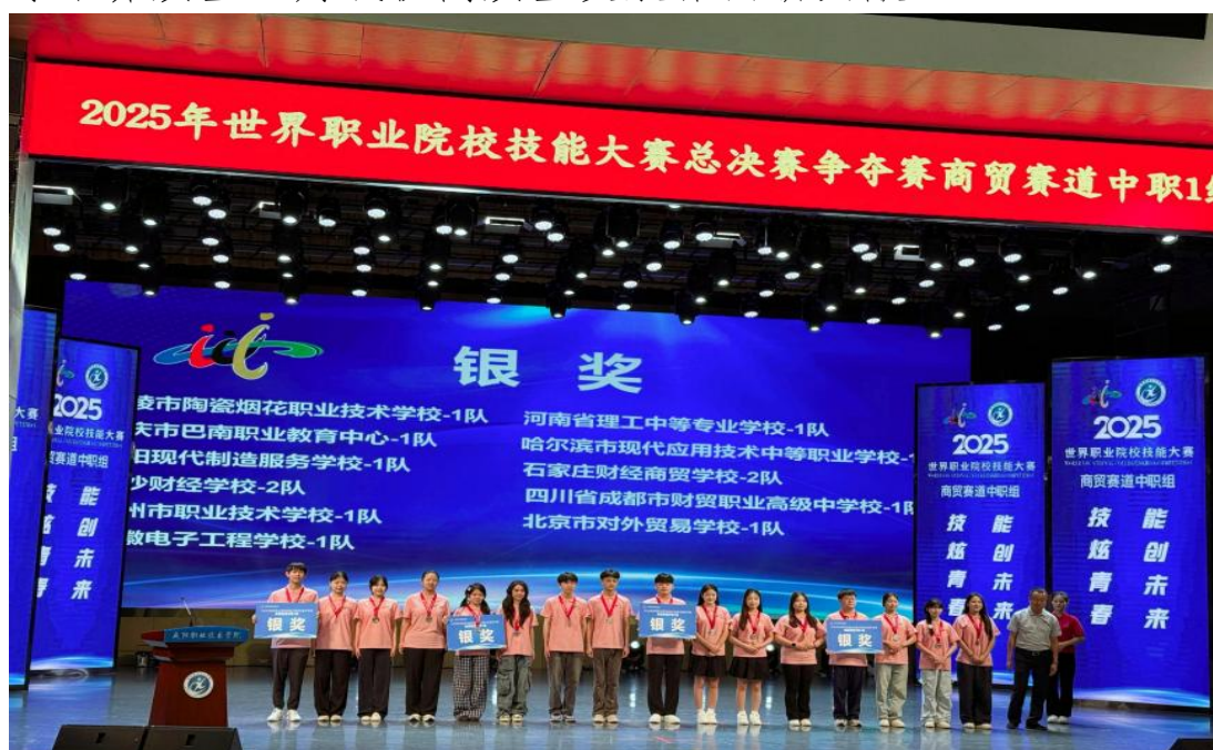
图7-10商贸赛道获奖照片

在下一步工作中，财经商贸系将继续坚持“以赛促教、以赛促学、以赛促改、以赛促建”，充分发挥大赛示范引领作用，持续推进“三教”改革、“岗课赛证”综合育人，深化产教融合，探索科教融汇新路径，不断提高人才培养质量，为我校高质量发展作出新贡献。