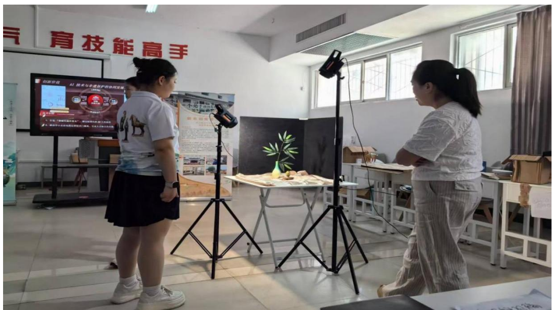
图7-4电子商务专业课堂教学

直播电商服务专业紧扣行业实战需求，依托学校省级品牌电商专业实训室资源，破解新专业“教学与岗位脱节”难题，构建适配中职学情的教学模式。具体做法如下：