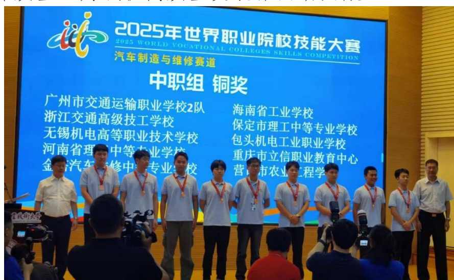
图7-11汽车制造与维修赛道获奖照片

在下一步工作中，汽车工程系将继续坚持“以赛促教、以赛促学、以赛促改、以赛促建”，充分发挥大赛示范引领作用，持续推进“三教”改革、“岗课赛证”综合育人，深化产教融合，探索科教融汇新路径，不断提高人才培养质量，为我校高质量发展作出新贡献。