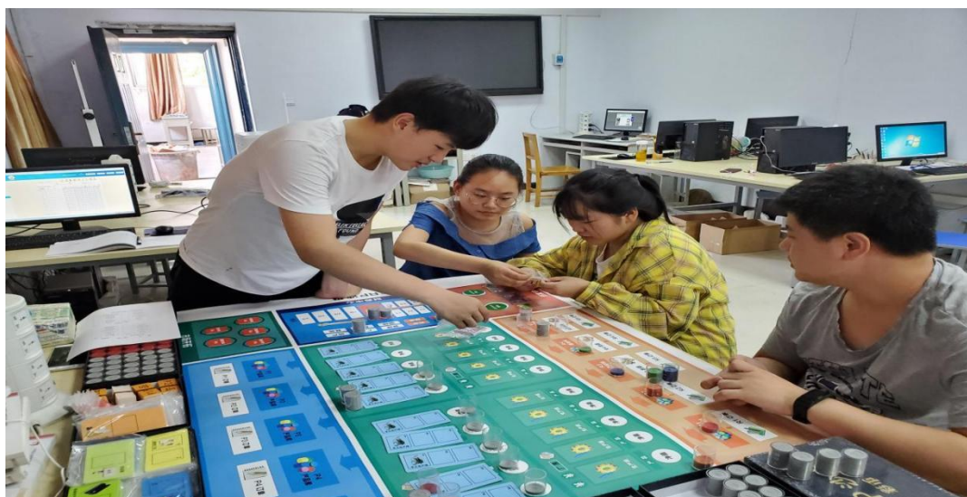
图7-9会计事务专业ERP沙盘模拟