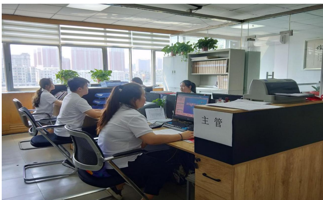
图4-20会计事务专业学生在企业实习

台。专业建成“智能财税实训室”“ERP沙盘模拟实训室”“会计分岗综合实训室”等校内实践场所，配备智能财税平台、模拟企业经营实训系统等，营造高度仿真的企业工作环境。2025年，2023级会计事务专业学生全部进入合作企业完成为期3个月的岗位实习，实习岗位涵盖出纳、会计核算、税务申报等，实习对口率达95%以上，企业满意度达96%。