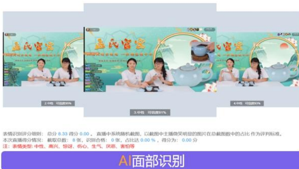
图7-7直播电商服务专业易直播实训平台

（3）理实一体化落地：以直播间为课堂，利用虚拟仿真平台开展全流程模拟，结合跨境电商资源库、省级精品课程线上预习，实现“做中学、学中做”。