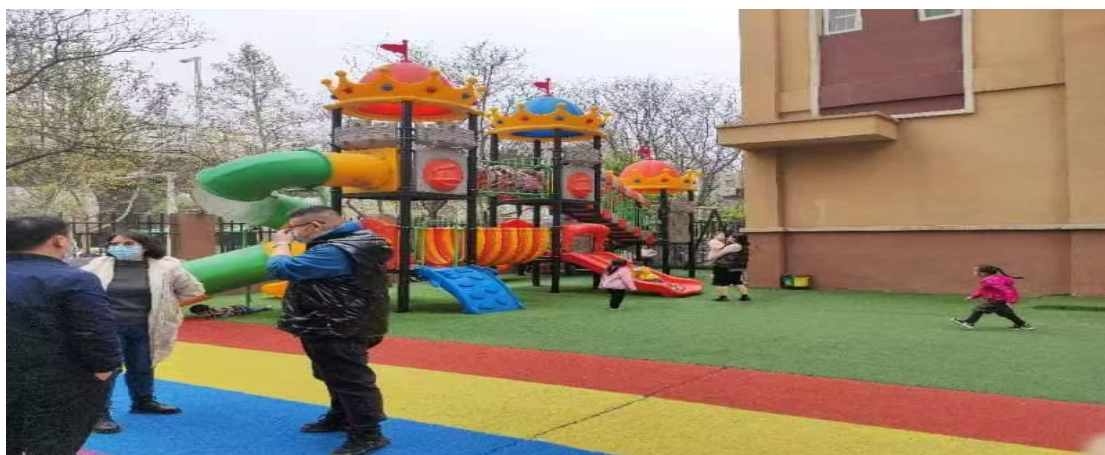
图7-12学校考察组考察幼儿园