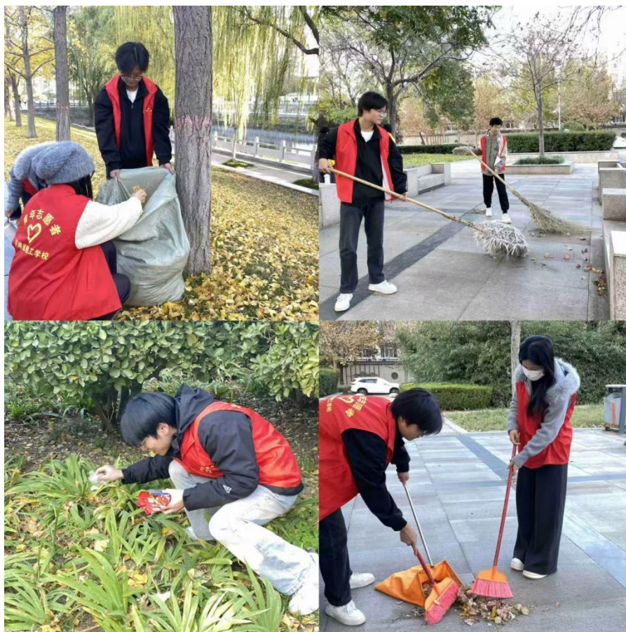
图2-1 东风渠义务劳动：清理垃圾，守护生态

学校积极与社区开展结对共创。为进一步发挥文明单位示范带动作用，助力全国文明城市创建，我校积极落实《省会郑州各级文明单位与实地点位结对共同推进全国文明城市创建工作实施方案》的要求，与郑州市金水区北林街道办事处院校社区结对共创，开展了结对互查活动，对标整治，提升了文明创建的水平。与社区签订《应急物资保障协议书》，将我校列为社区灾害物资保障单位，在灾情发生后，互助提供相应的救灾物资。