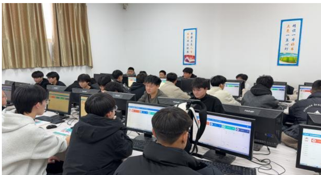
图1-2电子商务理实一体化平台

互动。系统以直播活动的策划、展示与推广为核心，内置直播策划直播推广、直播活动实施、直播效果分析与优化等模块，训练学生的微店开设、直播策划、直播推广、直播展示、直播互动及直播运营等能力。