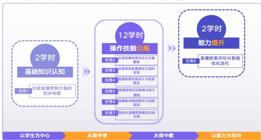
图7-5直播电商服务专业教学内容重构

（1）模块化课程重构：对接职业技能等级证书标准，拆解主播、运营等岗位能力，整合为“策划-执行-复盘”三大模块，嵌入电商直播实训系统、竞赛平台实操内容。