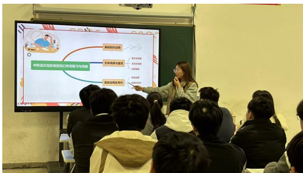
图4-11培优班课程学习