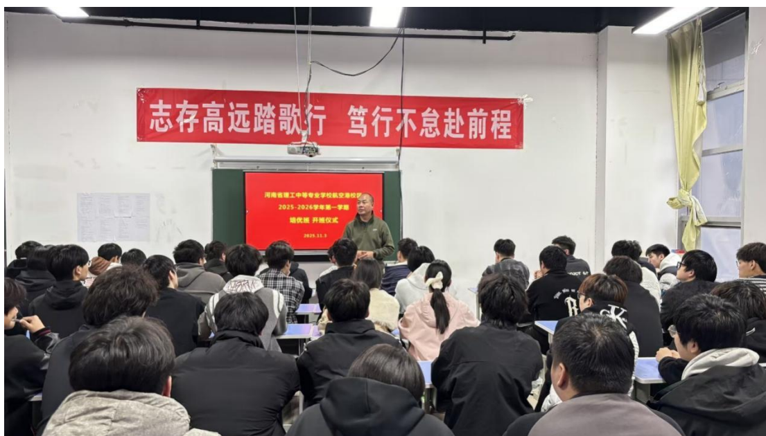
图4-10培优班开班仪式