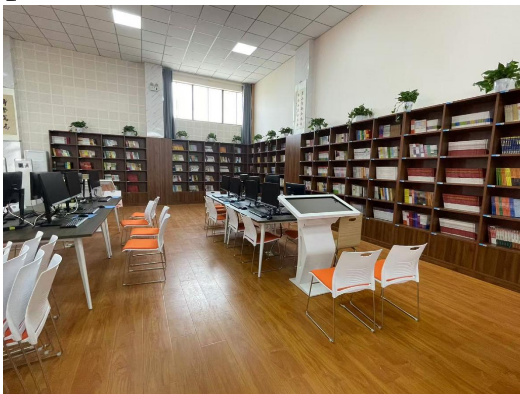
图5-1智慧阅览室一角

学校有可以实现教学、实训、交流、比赛、生产等功能的多专业多种类校内实训室、实训中心23个，占地面积总计约10000平方米。学校与企业共建有两个“校内教学工厂”实践教学基地，一个现代化物流实训中心，一个现代化电子商务实训中心；一个集实训、生产一体的数控机床实训中心；一个电焊车间；两间舞蹈形体训练房；四个技能大师工作室；两个会计实训室；一个智慧阅览室。一个集实践教学、社会培训、企业真实生产和社会技术服务于一体的汽车运用与维修专业高水平职业教育产教融合实训基地。