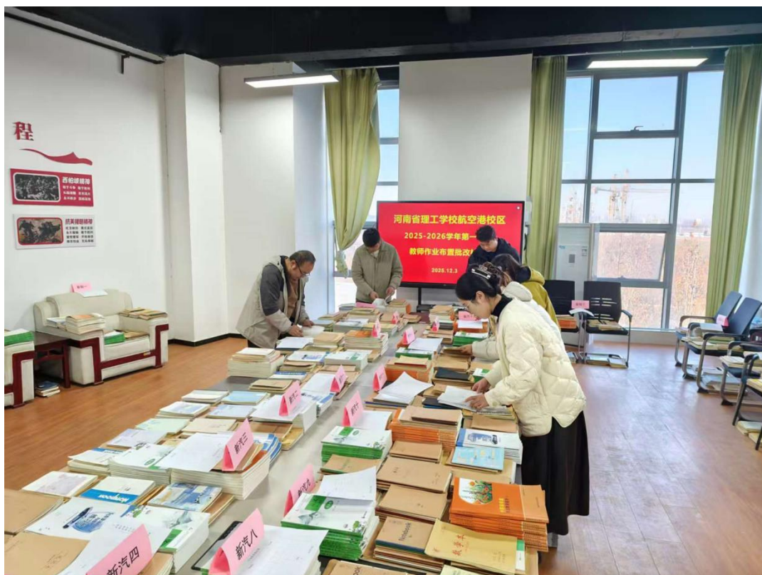
图4-12作业布置批改检查