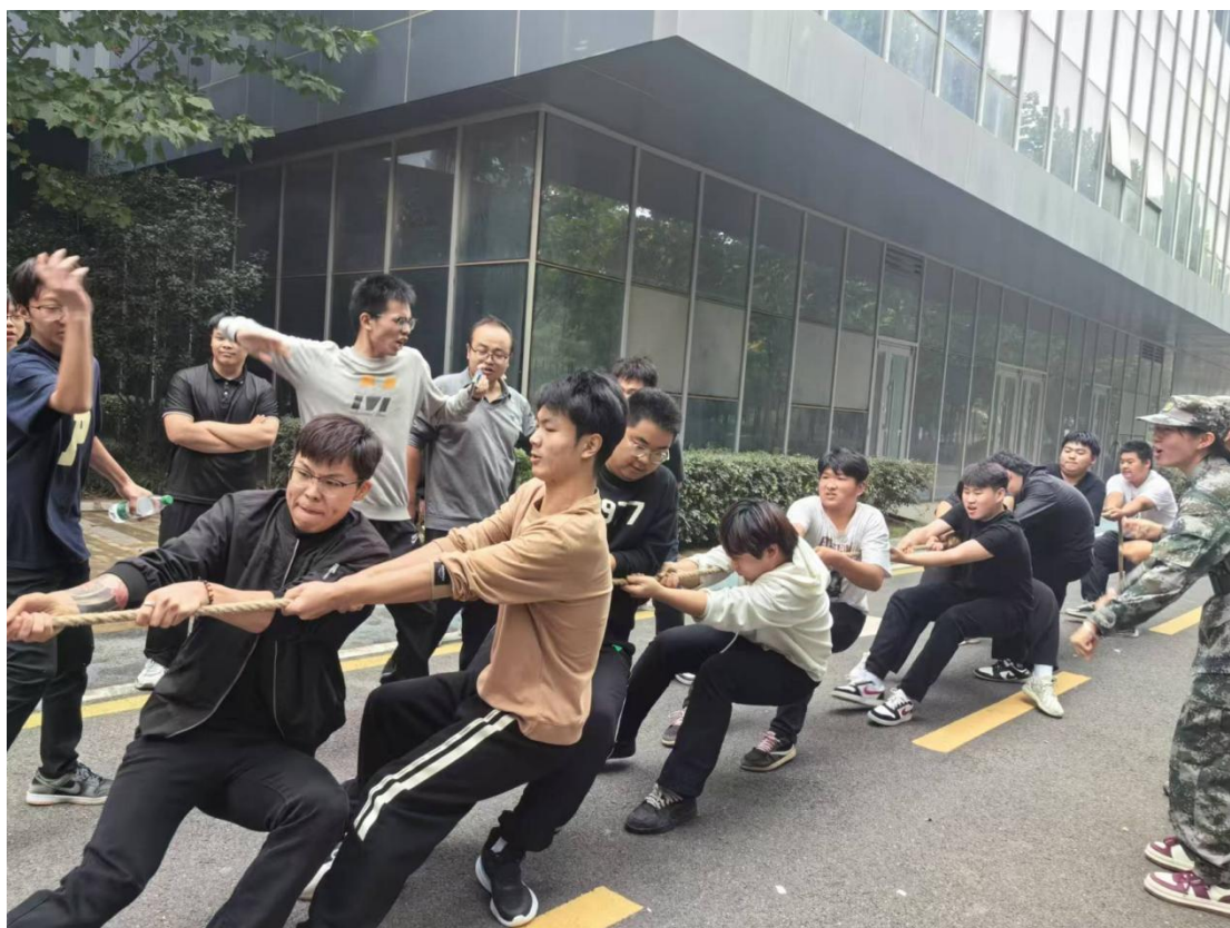
图4-16课余生活——拔河比赛