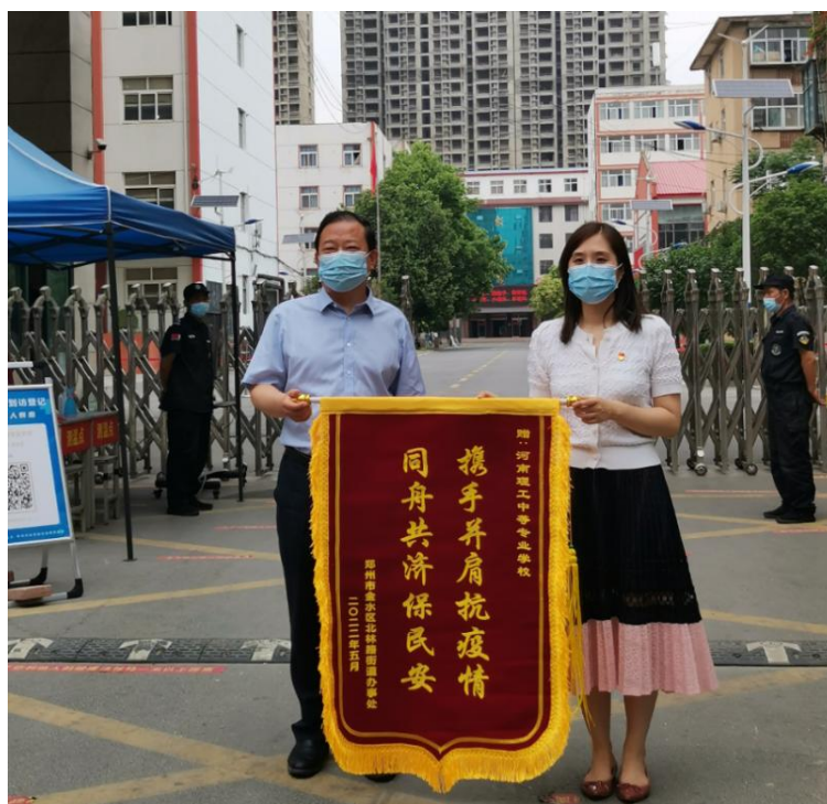
北林路街道办事处为我校颁发抗疫锦旗

学校积极与社区开展结对共创。为进一步发挥文明单位示范带动作用，助力全国文明城市创建，我校积极落实《省会郑州各级文明单位与实地点位结对共同推进全国文明城市创建工作实施方案》的要求，与郑州市金水区北林街道办事处院校社区结对共创，开展了结对互查活动，对标整治，提升了文明创建的水平。与社区签订《应急物资保障协议书》，将我校列为社区灾害物资保障单位，在灾情发生后，互助提供相应的救灾物资。