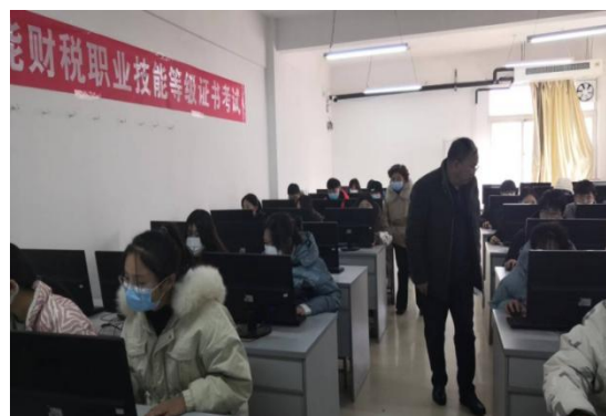
会计专业 1+X 证书认证