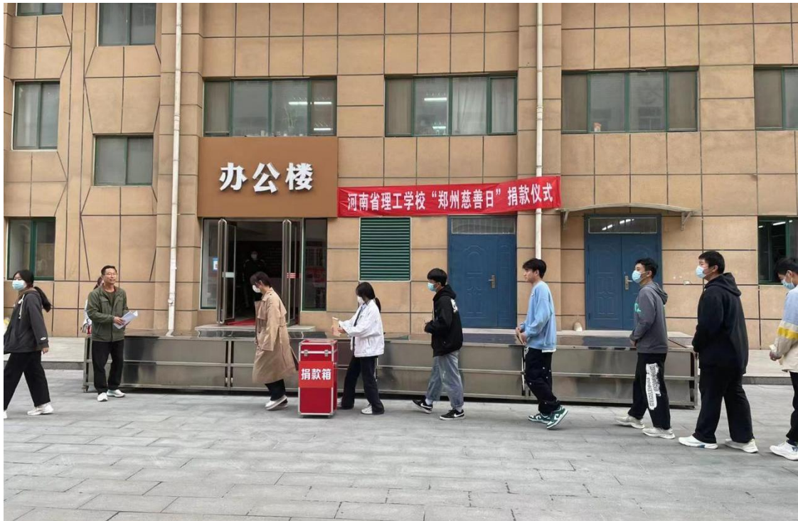
郑州慈善日捐款活动

积极开展“慈善日”捐款。在我国第七个“中华慈善日”和郑州市第十五个“郑州慈善日”到来之际，组织全体师生进行慈善捐款。