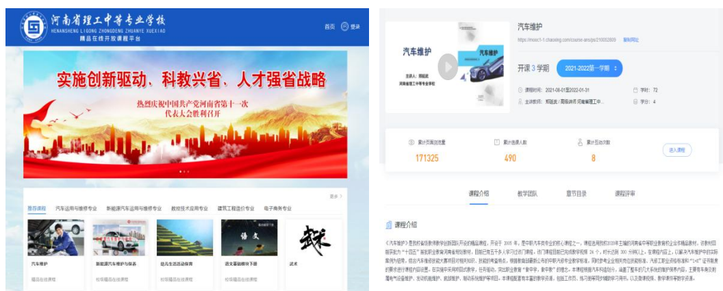
学校精品在线开放课程建设

学校在大力建设教育信息化基础设施的同时，不断加强教育信息资源的开发和建设，为我校教师运用信息技术提高教学质量奠定了良好的基础。如：为深入推进信息技术与教育教学深度融合，促进优质教育资源应用与共享，提高人才培养质量，学校开展校级职业教育精品在线开放课程建设工作，截止2022年8月，已完成《英语》、《基础会计》两门精品课程的建设工作；2022年9月，省级精品在线开放课程《汽车维护》获河南省教育厅推荐申报国家精品课程；升级电子商务技能和电子商务运营竞赛训练系统，为实训教学提供训练平台；电子商务专业申报2022年省级职业教育专业教学资源库。