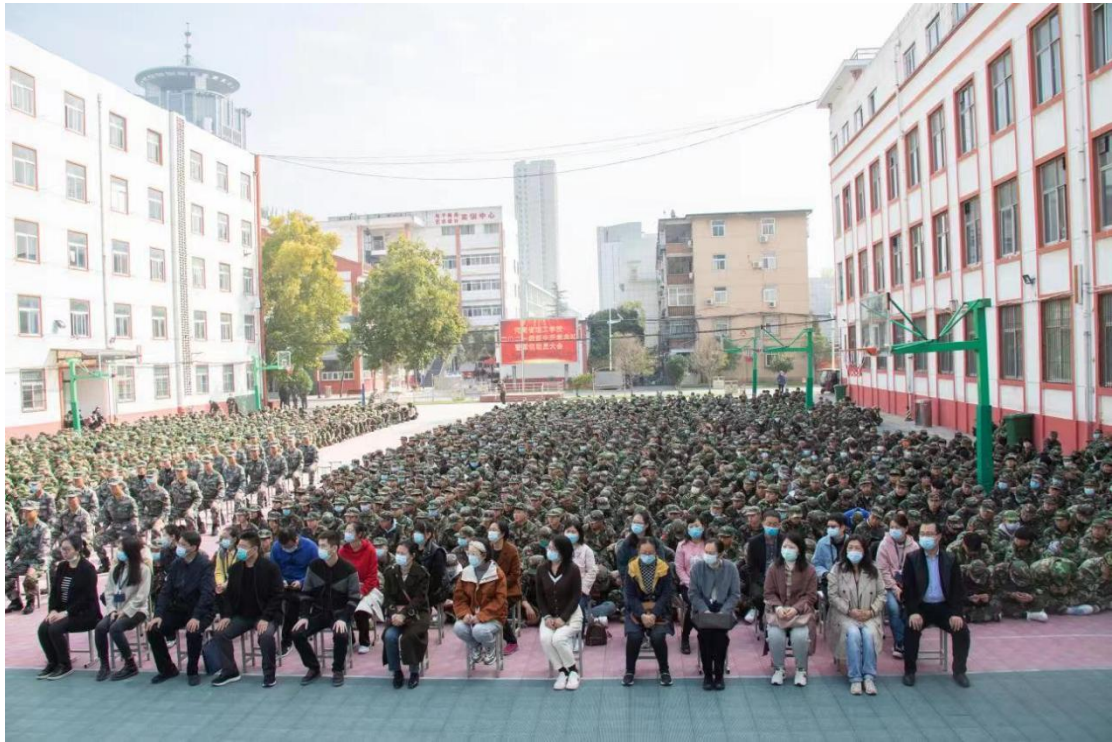
新生军训动员大会

今年是党的二十大胜利召开之年，为进一步激发全校生爱党、爱国、爱社会主义的热情，充分展示我省教育系统广大学生昂扬向上、奋发进取、团结拼搏的精神风貌，营造迎接、学习、宣传党的二十大的浓厚氛围，我校团委在学生中开展“青春献礼二十大、强国有我新征程”迎接学习宣传党的二十大主题宣传教育活动。