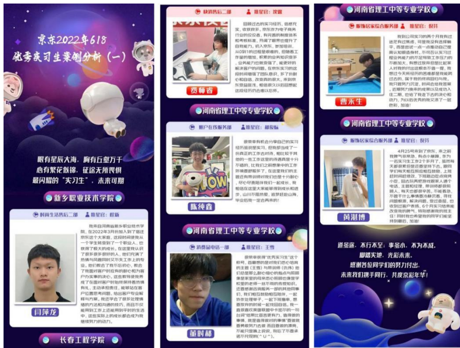
京东 2022 年 618 我校优秀实习生