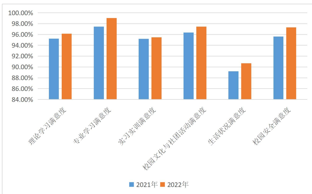
2020 年、2021 年在校生满意度调查情况