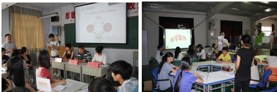
形式多样的课堂教学

学校在教育教学中，根据1+X证书考评要求、国家教学大纲、技能标准以及合作单位的用人要求，合理制定专业人才培养方案，并根据岗位任务和工作过程设计课程内容，实行项目式教学、模块化教学、案例教学等课堂教学模式，让学生熟悉并掌握相关专业的理论知识和实践技能，实现了做中学，学中做，理论教学与实践的统一，产教对接共同完成实训教学任务，形成了各具特色的教学模式。